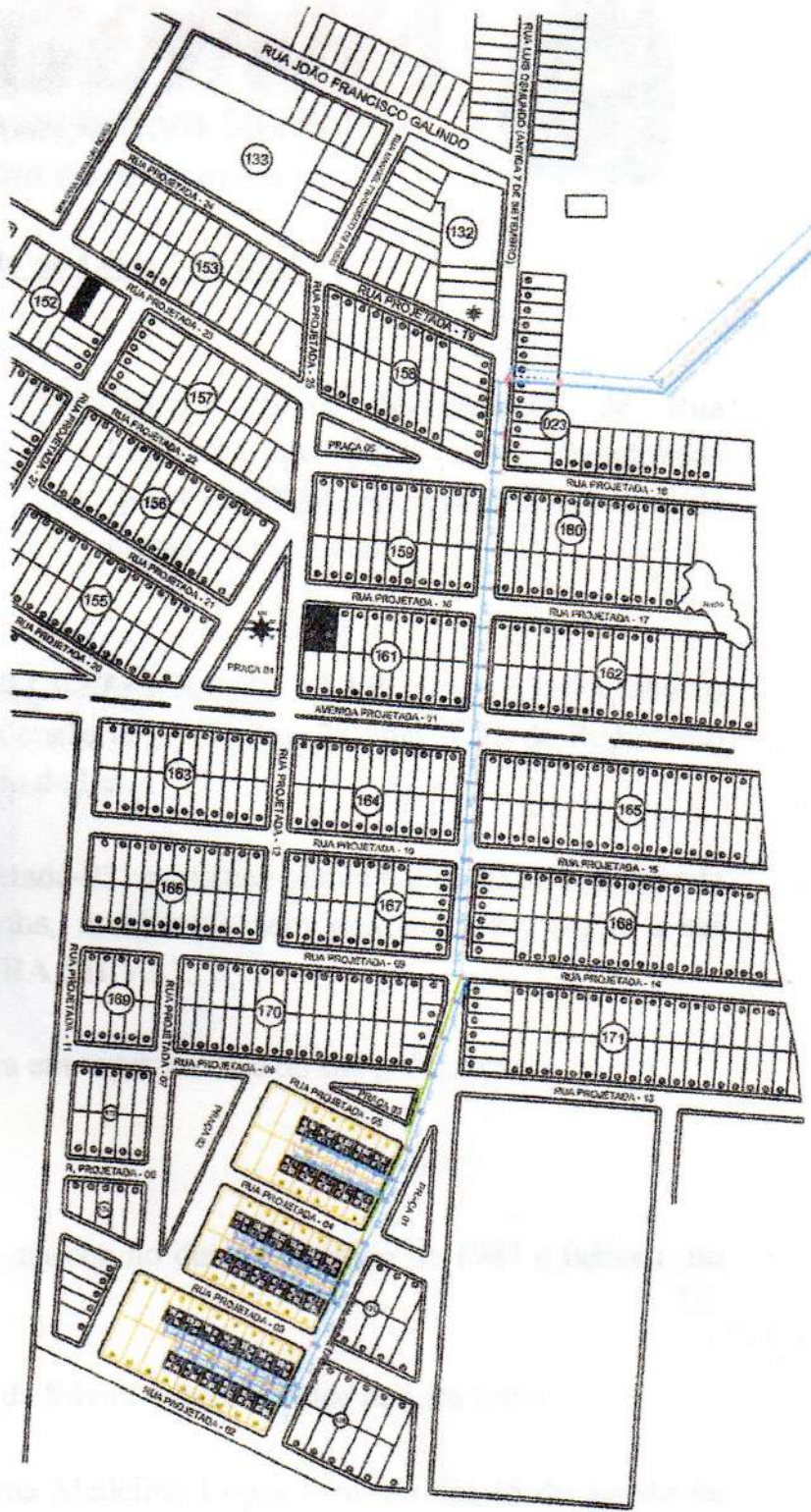
LOTEAMENTO DO CONJUNTO HABITACIONAL